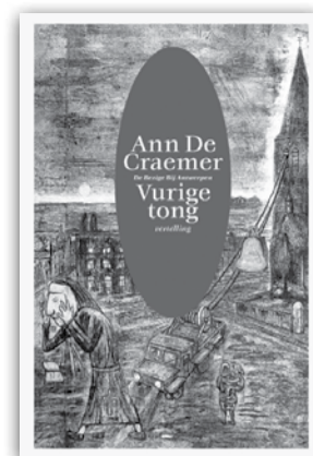
Ann De Craemer, Vurige tong. Vertelling , De Bezige Bij, Antwerpen, 192 blz., € 19,95. Bestellen kan via www.tertio.be

Voorals die veertien jaar leeftijdsverschil fascineren mij: hoe is het mogelijk dat iemand die twee mentale generaties jonger is, zo virulent tegen kerk en geloof ageert? Tijdens mijn Tieltsje jeugdijaren, in de vroege jaren 1980, voelde ik al scherp dat de katholieke cultuur van weleer haar dominante positie kwijt was. Toen ik in 1985 naar het seminarie trok, werd dat door mijn generatiegenoten warm noch koud onthaald omdat de meeste net als hun ouders geruisloos afscheid hadden genomen. Dat leek mij veeleer comfortabel dan vervelend en vooral dacht ik: de tijd van rekeningen vereffenen met de kerk is voorbij. De nieuwe generaties hebben de verstikkende machtskerk niet meer gekend, er niet meer onder geleden en voelen dus ook niet meer de behoefte er zich tegen af te zetten. De onwetendheid over geloofskwesties